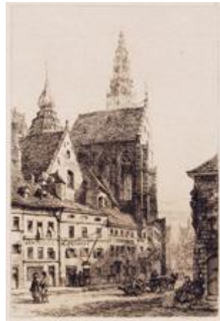
ANTWERP The Cathedral of Notre Dame