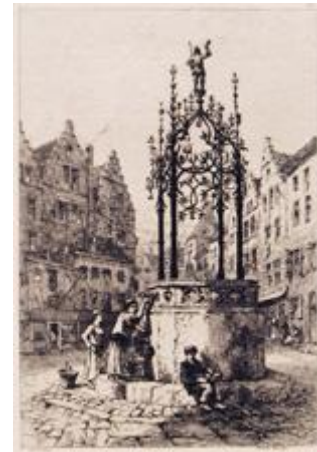
ANTWERP Well-Cover by Quentin Matsys